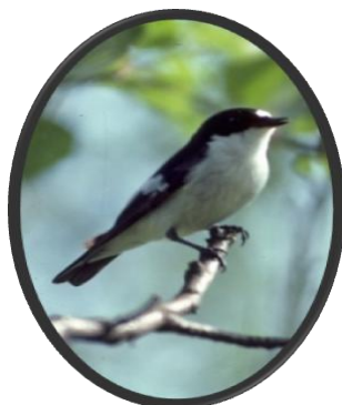
Svart-kvit- flugesnapper (hann)